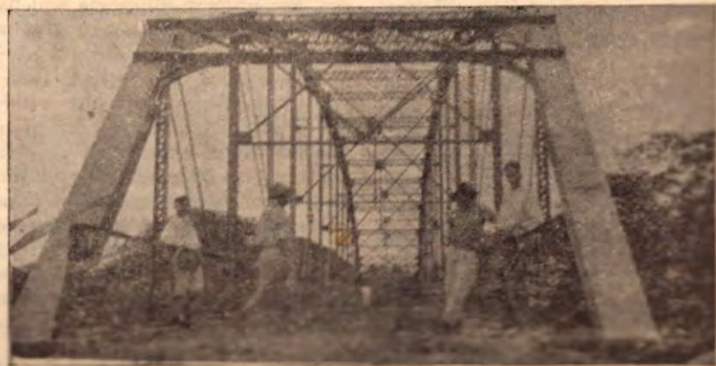
El puente sobre el Rio Barranca, poco tiempo antes de ser inaugurado.

"COSTA RICA DE AYER Y HOY" no está al servicio de ninguna causa política, social o religiosa. Sirve únicamente a la cultura.