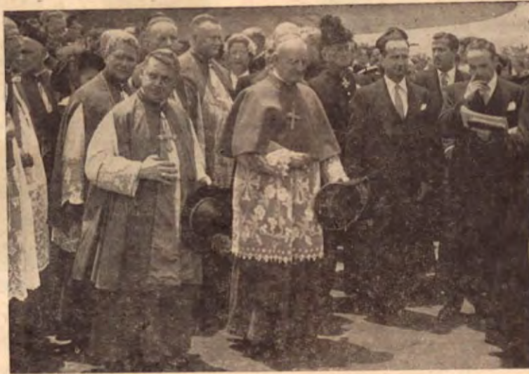
Los más altos Dignatarios de la Iglesia hacen acto de presencia en el Aeropuerto. Según esta foto de Schlicker, Su Eminencia el Arzobispo de Quito, Cardenal Carlos Mº de la Torre, Legado Pontificio al IIº Congreso Eucarístico Nacional, es acompañado por los altos Prelados y el Sr. Presidente de la República.

Después de las respectivas presentaciones de Su Eminencia y compañeros de viaje a los altos dignatarios de la iglesia de visita en el país, Arzobispos y Obispos de Guatemala, Honduras, El Salvador, Nicaragua, así como al Cuerpo Diplomático acreditado en Costa Rica, recibió los honores que le tributaron las Fuerzas Armadas, con salvas de veintidós cañonazos y la presencia ordenada y uniforme de las 1ª, 2ª y 3ª secciones de la Guardia Civil. Entre tanto una avioneta bicolor comenzó a revolotear sobre la concurrencia, dejando caer un sinnúmero de paraca-