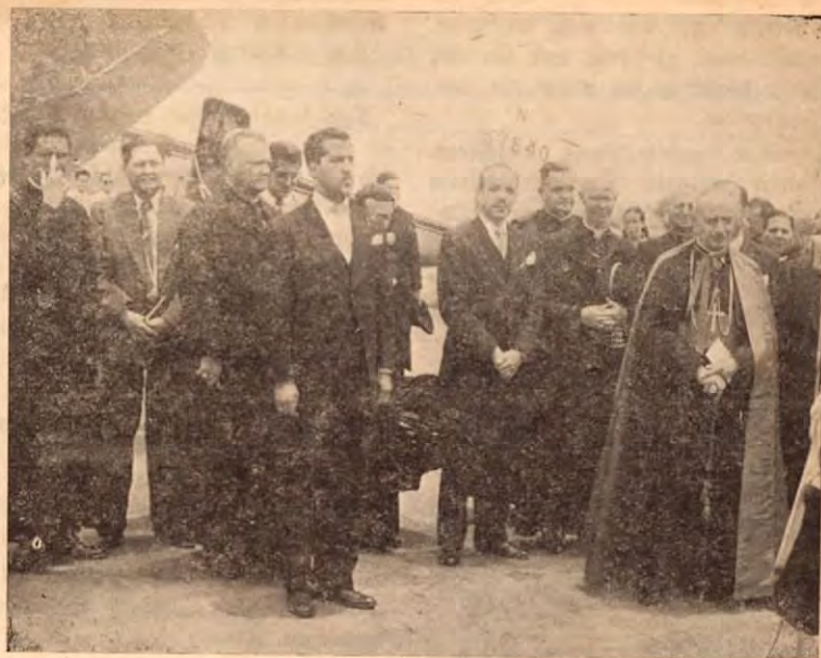
Despedida de Su Eminencia el Cardenal Legado del Papa en el Aeropuerto de La Sabana.

También se inauguraron las asambleas plenarias, presidiendo la primera el Excmo. y Revmo. Arzobispo Primado de Guatemala, Monseñor Rossell y Arellano, con asistencia de los Excelentísimos y Reverendísimos huéspedes. Hizo la a-